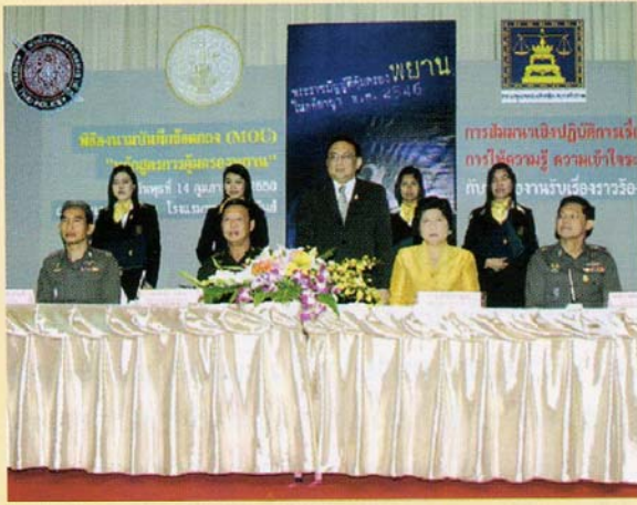
พิธีลงนาม MOU หลักสูตรคุ้มครองพยาน

ปฏิบัติการที่ทำหน้าที่นี้ผมมักเปรียบเสมือนว่า“สำนักงานคุ้มครองพยานเหมือนดาวเคราะห์ที่ไม่มีแสงในตัวเอง ต้องพึ่งพาแสงจากดาวฤกษ์ดวงอื่น” ดังนั้นพยานส่วนใหญ่จึงต้องประสานการส่งต่อให้เจ้าหน้าที่ตำรวจดูแล แต่จากการ Pre-test พยานที่ขอเข้าโปรแกรมการคุ้มครอง พบว่ามากกว่า 60% ต้องการให้เจ้าหน้าที่ของสำนักงานคุ้มครองพยานเป็นผู้คุ้มครองความปลอดภัย เพราะเหตุว่าสำนักงานเป็นหน่วยงานที่ทำหน้าที่นี้โดยตรง และเป็นหน่วยงานแรกที่พยานร้องขอให้คุ้มครองความปลอดภัยจึงมีความไว้เนื้อเชื่อใจกันแต่แรกและก็ต้องยอมรับความจริงว่าในบางคดีเจ้าหน้าที่ตำรวจอาจมีส่วนเกี่ยวข้องไม่ว่าทางตรงก็ทางอ้อม เป็นเหตุให้พยานมีความวิตกกังวลในการที่จะอยู่ในการดูแลของเจ้าหน้าที่ตำรวจ จึงเกิดคำถามว่าทำไมเราไม่คุ้มครองความปลอดภัยเอง และเป็นที่มาของคำว่า “ทำไม? คุณไม่ดูแลฉัน” ทั้งที่กฎหมายกำหนดให้คุณมีหน้าที่ ผมเคยถูกขู่ว่าจะฟ้องฐานละเว้นการปฏิบัติหน้าที่มาแล้ว ประเด็นปัญหานี้พวกเราในสำนักงานจะพบเจอเสมอ ก็ได้แต่พยายามทำความเข้าใจ และสร้างความเชื่อมั่นให้กับพยาน เพราะที่ผ่านมามีพยานที่ส่งต่อให้เจ้าหน้าที่ตำรวจได้รับการดูแลอย่างดี ทั้งที่เจ้าหน้าที่ตำรวจเองมีภารกิจมากมายอยู่แล้ว และก็มีพยานจำนวนไม่น้อยที่เข้าใจงานในหน้าที่ของตำรวจว่ามีงานมากไม่เอายารบกวอนให้ต้องมาคุ้มครอง