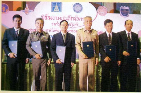
พิธีลงนาม MOU 7 หน่วยงานที่มีภารกิจคุ้มครองพยาน

หน่วยงานที่เกิดขึ้นใหม่ และทำงานภายใต้ข้อจำกัดมากมาย อย่างไรก็ตามสิทธิทั้ง 3 ประการได้เกิดขึ้นแล้ว แต่อาจจะยังไม่ครอบคลุมทั่วถึง มีการตราพระราชบัญญัติคุ้มครองพยานในคดีอาญา พ.ศ. 2546 และระเบียบกระทรวงยุติธรรมว่าด้วยค่าตอบแทนและค่าใช้จ่ายแก่พยานฯ พ.ศ. 2547 เพื่อรองรับสิทธิดังกล่าวในส่วนที่เกี่ยวข้องกับการปฏิบัติที่เหมาะสม อยู่ระหว่างดำเนินการศึกษาวิจัย เพราะเกี่ยวข้องกับหลายหน่วยงานในกระบวนการยุติธรรมทางอาญา