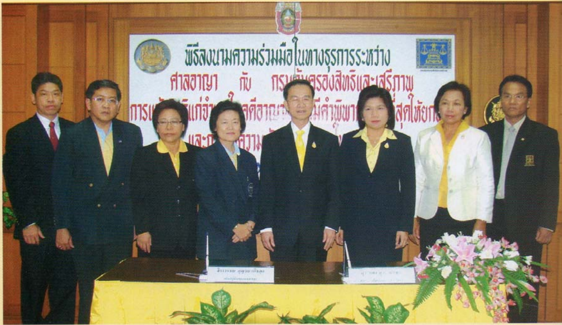
พิธีลงนาม MOU กับศาลอาญา

ทำหน้าที่ทั้ง Regulator และ Operation แต่ผมเชื่อมั่นว่าเราพัฒนางานมาได้ระดับหนึ่งแล้วแม้จะยังไม่เทียบเท่ากับหลายประเทศที่ประสบความสำเร็จในการใช้กฎหมายคุ้มครองพยาน ไม่ว่าจะเป็นสหรัฐอเมริกา ออสเตรเลีย นิวซีแลนด์ ที่ใช้กฎหมายนี้กันมานาน 30 - 40 ปีแล้ว