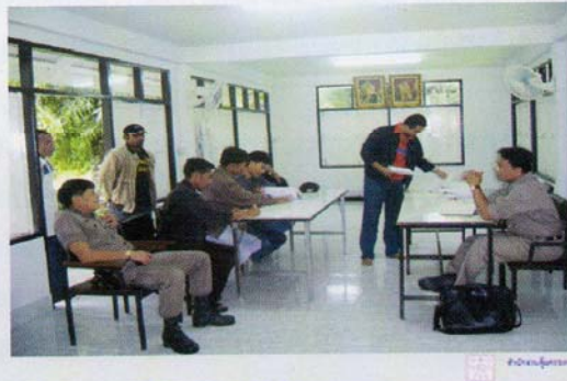
ศูนย์ประสานงานคุ้มครองพยาน จ.ยะลา

อย่างไรก็ตามสำนักงานไม่สามารถที่จะจัดเจ้าหน้าที่ไปคุ้มครองพยานได้มากนัก เพราะเราเองก็มีภารกิจอื่นอีกมากมายเช่นกัน จะทำเฉพาะ Case ที่ไม่อาจอยู่กับหน่วยงานอื่นได้จริงๆ หรือ Case ที่ถูกส่งต่อมาจากหน่วยงานอื่นก็เคยมี งานคุ้มครองพยานก็เป็นอย่างนี้ละครับ เพราะบางครั้งเราก็ไม่สามารถ Show Case ได้ แต่ก็ยืนยันครับว่ามีพยานในคดีสำคัญ ทั้งที่เป็นข่าวและเป็นข่าวตามสื่อเข้าโปรแกรมการคุ้มครองพยานจำนวนมาก ทั้งที่อยู่ในการคุ้มครองของสำนักงานคุ้มครองพยาน สำนักงานตำรวจแห่งชาติ และกรมสอบสวนคดีพิเศษ และก็เป็นที่น่ายินดีครับคดีที่พยาน